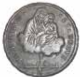
Une monnaie d'argent de dix paoli, imprimée à Bologne en 1796