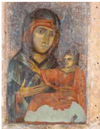
Icono bizantino del los siglos X-XI, restaurado en el siglo XII-XIII, adorado sobre la Colina de la Guardia desde finales del siglo XII