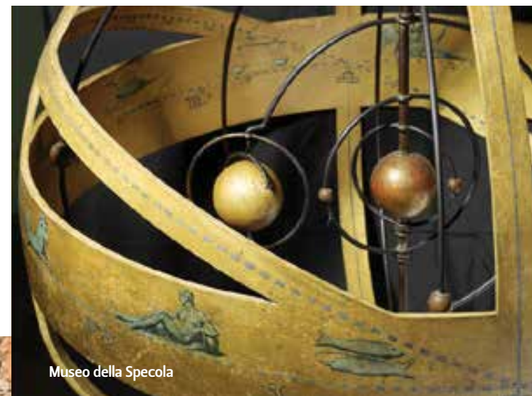
Museo della Specola

Straordinaria cornice della Basilica di Santa Maria dei Servi, il Portico dei Servi è stato teatro di alcune delle più grandi disfide matematiche. Questa tradizione risale al Rinascimento, quando, per risolvere controversie tra studiosi, venivano indetti veri e propri duelli pubblici. Di fronte ad una folla di spettatori, due o più matematici gareggiavano nella risoluzione degli stessi problemi, spesso proposti e risolti in rima, veri e propri "teoremi in poesia". Una delle più importanti disfide del '500, quella che portò alla risoluzione delle equazioni di terzo grado ad opera di Scipione dal Ferro, ebbe luogo proprio sotto il Portico dei Servi.