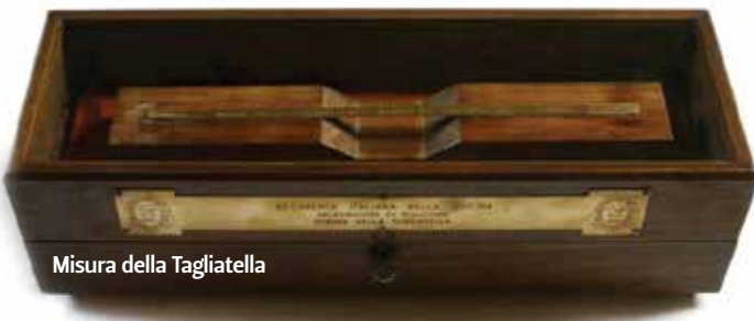
Misura della Tagliatella

Dal 1972 al suo interno è esposto un campione in oro della vera Tagliatella bolognese, la cui larghezza corrisponde alla 12.270esima parte della Torre degli Asinelli: un esempio tipicamente bolognese della procedura internazionalmente seguita per definire le unità di misura standard.