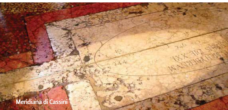
Meridiana di Cassini