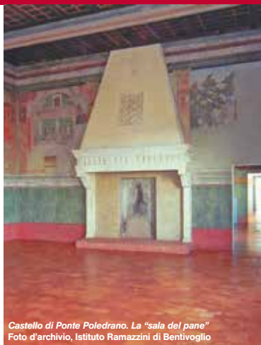
Castello di Ponte Poledrano. La "sala del pane"

Grafiche E. GASPARI - Cadriano di G. (BO) - stampa marzo 2015