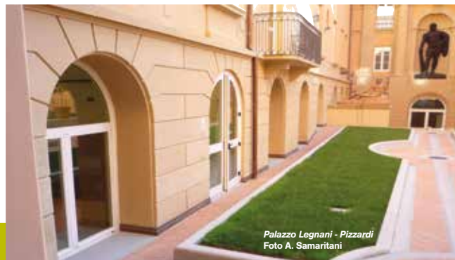
Palazzo Legnani - Pizzardi