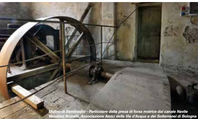
Mulino di Bentivoglio - Particolare della presa di forza motrice dal canale Navile Massimo Brunelli, Associazione Amici delle Vie d'Acqua e dei Sotterranei di Bologna

Il mulino di Bentivoglio viene edificato da Guido Lambertini sulle rive del canale Navile intorno alla metà del 1300, quando l'arte molitoria rappresenta il cardine dell'economia della bassa pianura bolognese. Nel 1817 la famiglia Pizzardi acquista il vasto complesso di edifici sorto tra i due rami del canale e l'ultimo proprietario, il marchese Carlo Alberto, lo modernizza realizzando ampliamenti e nuove strutture al servizio della propria impresa agricola e facendo installare all'interno del mulino, dopo il 1900, nuove macchine della ditta Alessandro Calzoni. Dato in locazione tra il 1930 e il 1960, il Mulino Pizzardi viene definitivamente chiuso nei primi anni Settanta. Il complesso rimane un patrimonio straordinario dell'archeologia industriale del territorio bolognese.