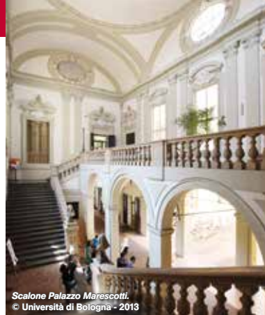
Scalone Palazzo Marescotti. © Università di Bologna - 2013

Qui abita la nonna materna di Carlo Alberto, Elena Gozzadini Marescotti, che si occupa dei nipoti (tre maschi e una femmina) dopo la morte di parto della figlia, ancora giovanissima. L'elegante