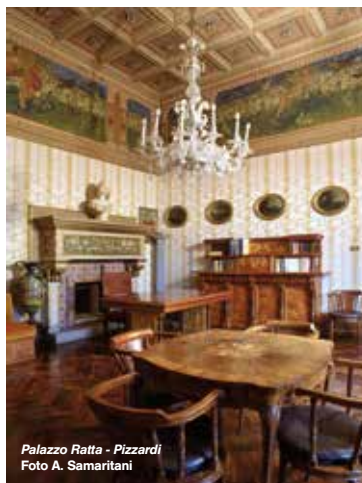
Palazzo Ratta - Pizzardi

Nel 1894 il Marchese Pizzardi decide di sottoporre le sale del palazzo, recentemente acquistato come sua abitazione, ad importanti lavori di abbellimento che si protraggono oltre il 1897. Gli interventi sono opera di Alfonso Rubbiani e dei suoi collaboratori del gruppo Emilia Ars . Gli interni dell'appartamento al primo piano sono progettati dallo stesso Rubbiani assieme ad Augusto Sezanne ed eseguiti poi dall'ebanista Vittorio Fiori secondo una visione unitaria di grande coerenza. I fregi di Achille Casanova dipinti lungo le pareti e gli arredi costituiscono uno degli esempi più interessanti del liberty bolognese. Il cinquecentesco palazzo, ultima residenza cittadina della famiglia Pizzardi, è ancora oggi sede dell'Amministrazione centrale degli Ospedali di Bologna. Per informazioni: 051 230260