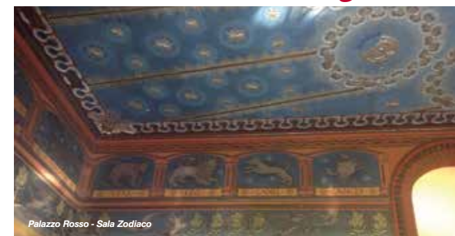
Palazzo Rosso - Sala Zodiaco

Così detto per i mattoni con cui è stato costruito, è uno dei più noti esempi della stagione Liberty bolognese. Realizzato tra il 1891 e il 1893 per volontà del marchese Pizzardi come abitazione padronale, originariamente si protendeva sul Navile: in corrispondenza dell'ingresso è ancora visibile il sostegno, sistema di chiuse che