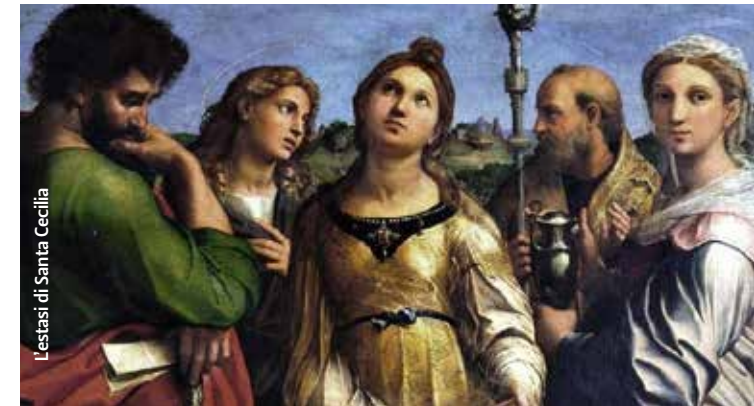
L'estasi di Santa Cecilia

Qui è conservata la tomba della Beata Elena Duglioli (1472-1520). Per lei venne realizzata l' Estasi di Santa Cecilia di Raffaello, oggi custodita presso la Pinacoteca Nazionale di Bologna, mentre