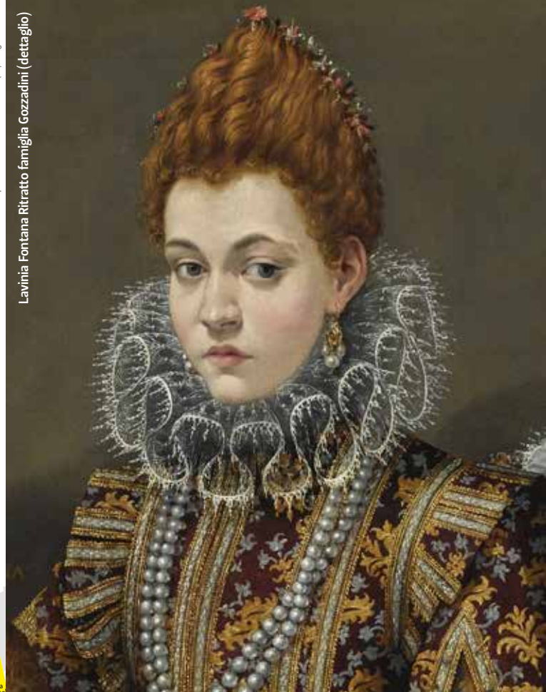
Lavinia Fontana Ritratto famiglia Gozzadini (dettaglio)