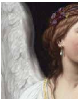
Sirani Elisabetta. Allegoria della Virtù (dettaglio)

del Rosario che fanno da corona alla nicchia con l'immagine della Beata Vergine. La realizzazione dei dipinti fu affidata ad insigni pittori bolognesi: Gesù tra i Dottori è opera di Lavinia così come L'incoronazione della Vergine . Venne chiamata a Roma per lavorare e lì rimase fino alla morte avvenuta nel 1614. Nel 1665 si celebrano in questa basilica, i funerali della giovane Elisabetta Sirani, morta due mesi e mezzo prima ma sepolta solo dopo lunghissime indagini. Ricevette una rigida educazione dal padre, il pittore Giovanni Andrea, che le impedì di allontanarsi da Bologna forse per farsi aiutare nella pittura quando si ammalò di artrosi. Elisabetta, artista di rara sensibilità, seppe circondarsi di molte allieve che proseguiranno la professione. Morì improvvisamente dopo due giorni di straziante agonia tanto che iniziarono a circolare voci di un presunto avvelenamento. La sua sepoltura è, assieme a quella di Guido Reni, nella Cappella del Rosario.