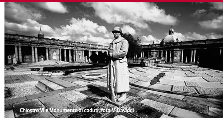
Chiostro VI e Monumento ai caduti