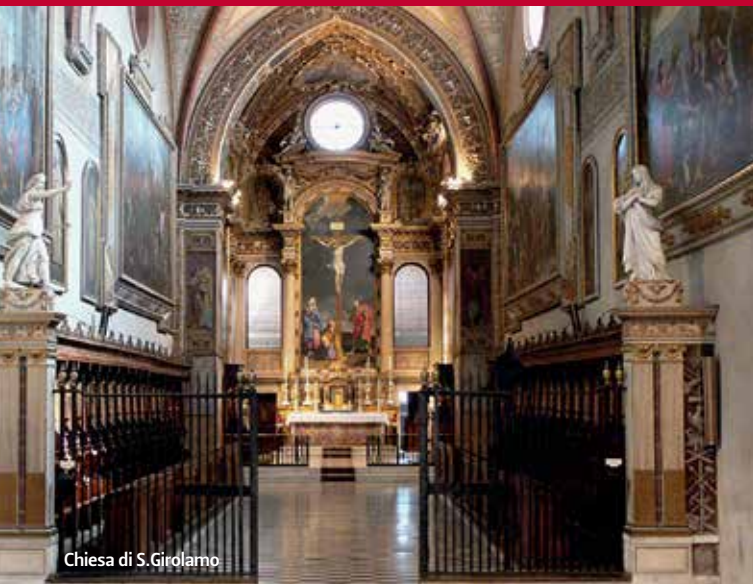
Chiesa di S. Girolamo

Il cimitero viene fondato nel 1801 riutilizzando le strutture del cenobio certosino edificato a partire dal 1334 e soppresso da Napoleone nel 1796. La chiesa di S. Girolamo (1) è testimonianza della ricchezza perduta del monastero. Alle pareti spicca il grande ciclo di dipinti dedicati alla vita di Cristo, realizzato dai principali pittori bolognesi della metà del XVII secolo.