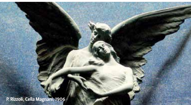
P. Rizzoli, Cella Magnani, 1906

I tre campi riservati agli ebrei a partire dal 1869, sono testimonianza visibile a Bologna della piccola ma importante comunità giudaica locale. Oltre alle semplici memorie che rispecchiano i dettami religiosi, si trovano monumenti di maggior impegno monumentale, a volte ornati da ritratti, sintomo della volontà di segnalare, dopo il raggiungimento dei diritti civili e religiosi di fine '800, l'appartenenza alla società italiana.