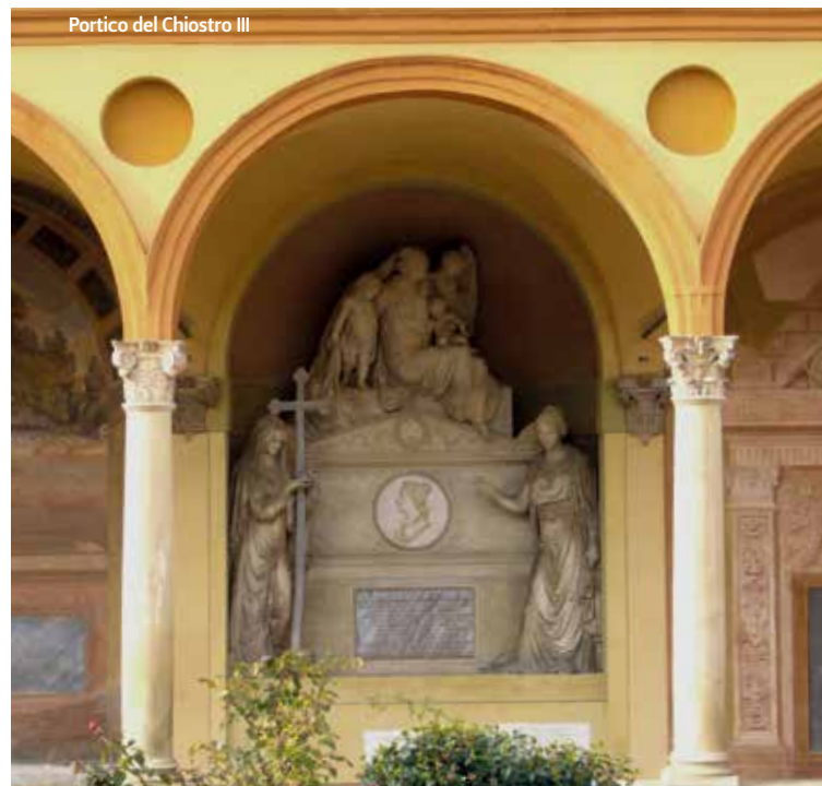
Portico del Chiostro III