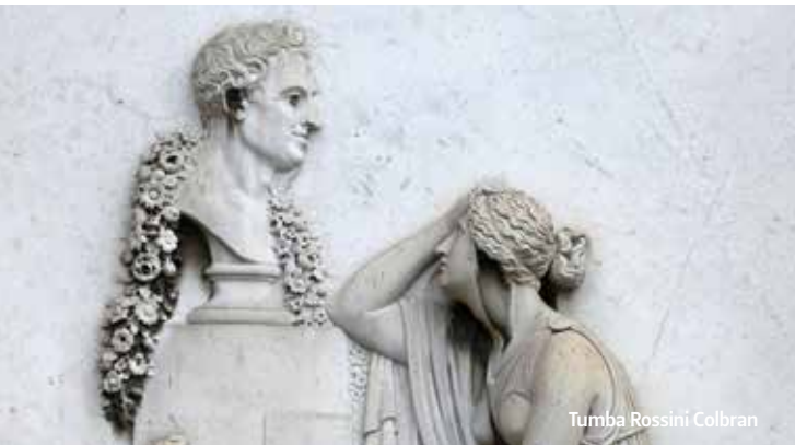
Tumba Rossini Colbran