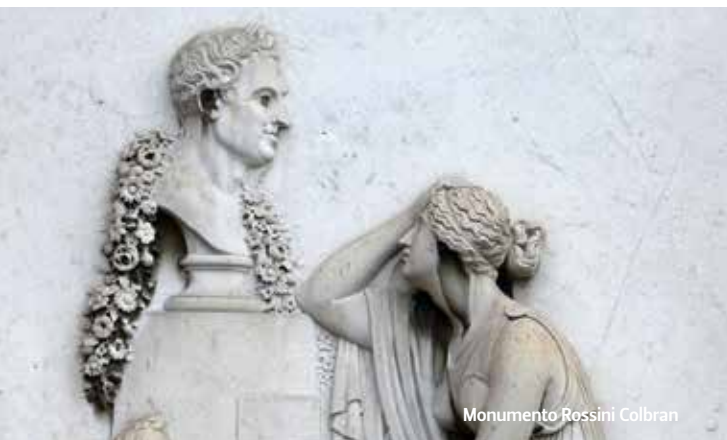
Monumento Rossini Colbran