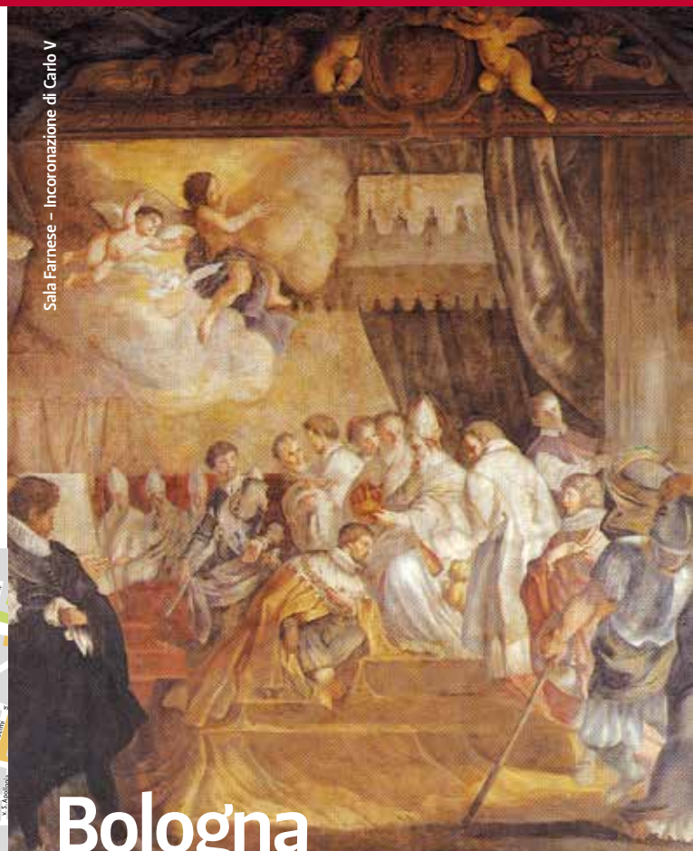
Sala Farnese - Incoronazione di Carlo V