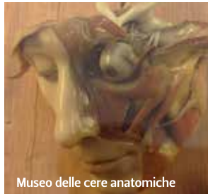
Museo delle cere anatomiche