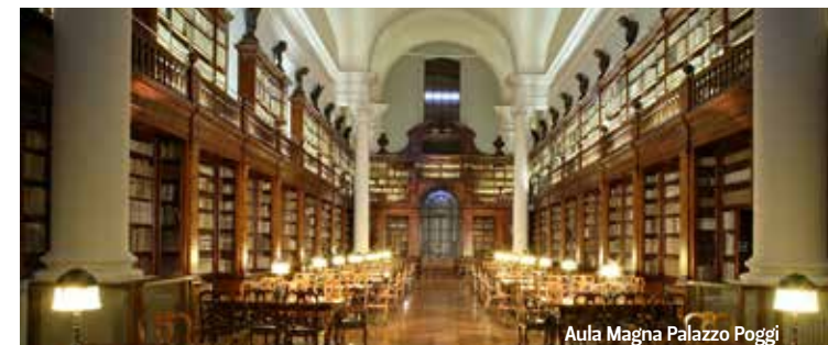
Aula Magna Palazzo Poggi

All'interno del cinquecentesco Palazzo Poggi uomini come Ferdinando Marsili, Francesco Maria Zanotti, Ercole Lelli, Prospero Lambertini (futuro Papa Benedetto XIV) ristabilirono il primato culturale di Bologna. Il Senato bolognese non esitò così ad accettare la proposta di Marsili di fondare un Istituto delle Scienze devolvendo libri e strumenti. In cambio la municipalità avrebbe provveduto a una sede, a pagare il salario degli studiosi e a edificare un osservatorio astronomico. Un luogo storico quello che il cardinale Poggi fece edificare. Non a caso Napoleone lo