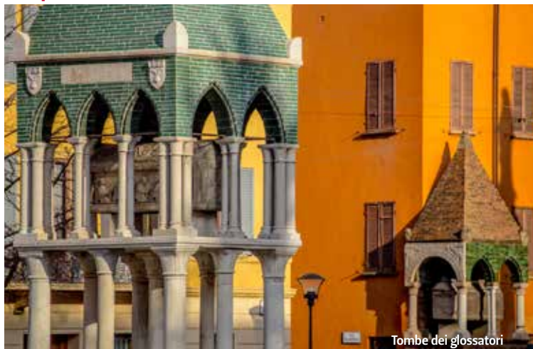
Tombe dei glossatori

I Glossatori, giuristi appartenenti alla Scuola di Bologna fondata da Irnerio nel secolo XI, erano così denominati dal genere letterario in cui si esprime la loro attività scientifica: allegare ai testi di diritto canonico e di diritto civile delle annotazioni dette "glosse", che chiarivano il significato del testo. Attraverso il loro studio capillare, i glossatori non solo raggiunsero la piena padronanza dell'antico Corpus Iuris Civilis di Giustiniano, ma resero quest'ultimo effettivamente applicabile alla vita giuridica del tempo. I lettori dello Studio godevano a Bologna di alto prestigio sociale. Ne sono prova le tombe che popolano le piazze: quelle di Foscherari e di Rolandino Passeggeri in piazza San Domenico e quelle del glossatore Accursio e del figlio Francesco, del giurista Odofredo e di Rolandino in piazza San Francesco.