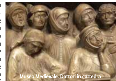
Museo Medievale. Dottori in cattedra

Il museo custodisce una raccolta di monumenti funerari che miravano a diffondere un'immagine prestigiosa dei docenti: nel sepolcro di Bonifacio Galuzzi, opera di Bettino da Bologna, e nell'arca di Giovanni d'Andrea ricorre la tipologia del dottore in cattedra colto nell'atto di impartire lezioni ai suoi studenti. Al museo si trova anche la Lapide della Pace (1222), realizzata per commemorare il patto tra studenti e Comune, redatto dopo che l'autorità cittadina aveva giustiziato uno scolaro colpevole di aver insidiato una gentildonna.