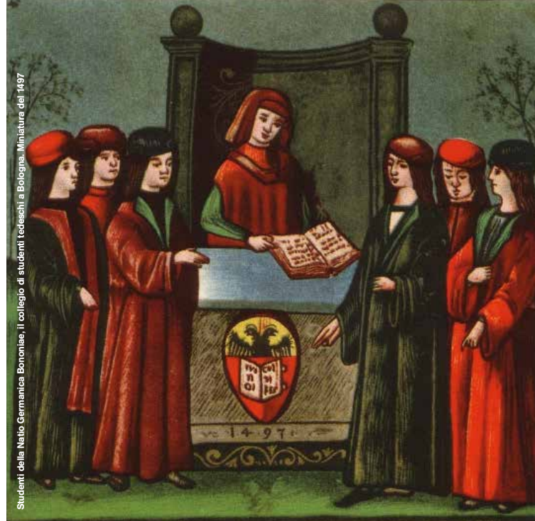
Studenti della Natio Germanica Bononiae, il collegio di studenti tedeschi a Bologna. Miniaturo del 1497