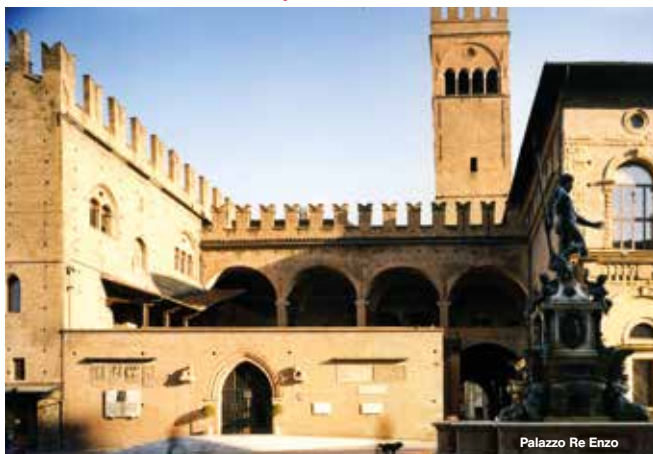
Palazzo Re Enzo

Heinrich, conosciuto come Enzo di Svevia o di Hohenstaufen, è figlio naturale di Federico II e suo braccio destro. Tra il 1239 e il 1249 è tra i principali protagonisti dello scontro nell'Italia centrosettentrionale tra l'Impero, i Comuni e il Papato. Catturato dai Bolognesi nel 1249, viene