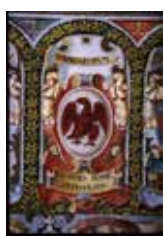
Stemmi Nazione Alemanna

Nel palazzo dell'Archiginnasio, sede dell'Università dal 1563, è presente un complesso araldico di quasi 6000 stemmi e tra questi molti sono di studenti di lingua tedesca. I primi studenti di Bologna si organizzano in collegi per prestarsi aiuto fra compagni della stessa nazionalità.