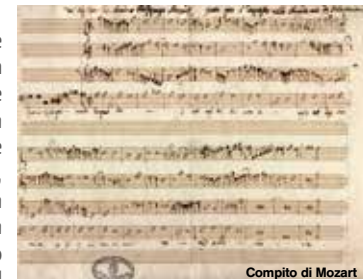
Composito di Mozart