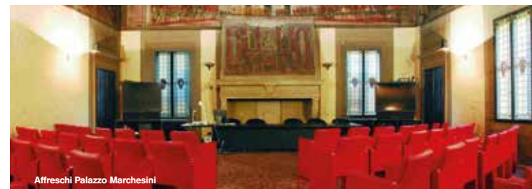
Affreschi Palazzo Marchesini

Al Museo della Storia di Bologna (sala 13) i protagonisti di questo avvenimento storico, vengono ritratti nelle opere videoproiettate di Bartolomeo Cesi. ( www.genusbononiae.it )