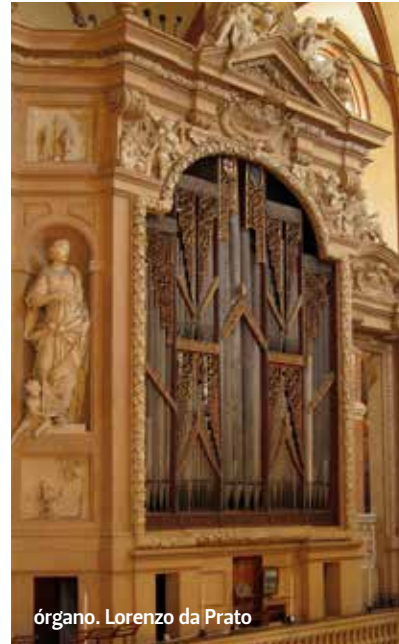
órgano. Lorenzo da Prato

de las más importantes campanas de la ciudad boloñesa – hoy día se ven sólo externamente – destinadas a marcar desde el Medioevo el ritmo de los eventos civiles y religiosos. La primera se colocó a comienzos del Cuatrocientos en la Torre del Reloj del Palacio Municipal (Torre dell'Orologio del Palazzo Comunale), seguida en 1453 por la gigantesca campana (en torno a 47 quintales) en la "Torre dell'Arengo" usada para llamar a los ciudadanos cuando se celebraran eventos políticos o sociales. Por último el campanario de S. Petronio donde, en el año Quinientos se elabora un sistema de montaje donde tiene lugar el concierto de las cuatro campanas con una rotación de 360°, un arte de la campana llamado "a la boloñés" hasta hoy día transmitido de padre a hijo.