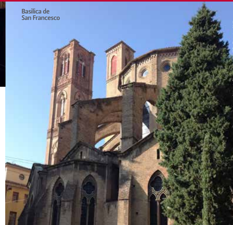
Basilica de San Francesco

En este convento Giovan Battista Martini transcurre su vida de religioso y erudito musical. Fue sepultado en 1784 como lo recuerda una inscripción en la primera arcada a la derecha de la iglesia. Aquí reúne sus colecciones musicales, hoy conservadas en el Museo de la música. Su cultura enciclopédica le dio fama internacional y la visita de maestros italianos y europeos de paso por la ciudad, atrayendo a alumnos como W. A. Mozart y J. C. Bach a quien les dio lecciones en su celda, desafortunadamente destruida.