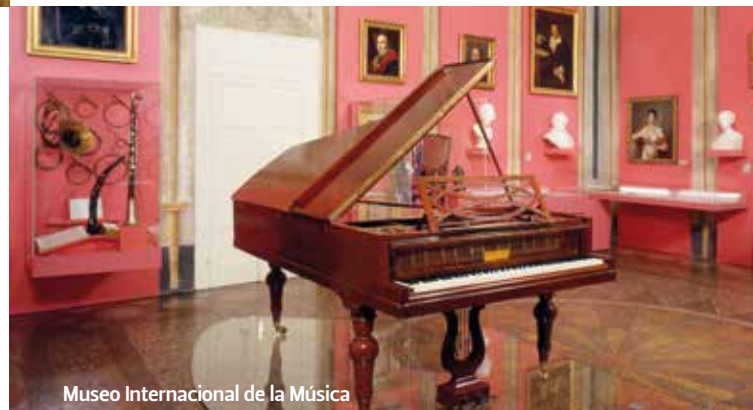
Museo Internazionale della Musica