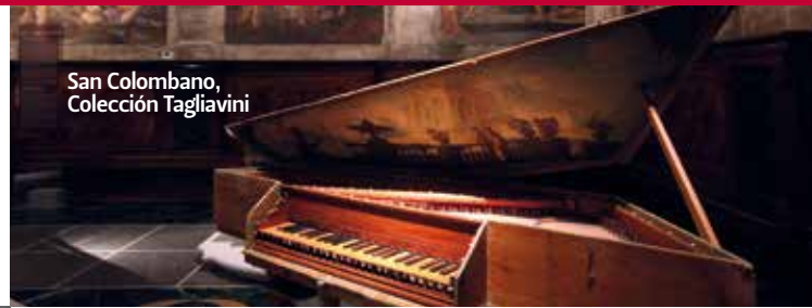
San Colombano, Colección Tagliavini

San Colombano es un conjunto canónico compuesto por una serie de edificios poco a poco añadidos en los siglos, más o menos a partir del Seiscientos diez. El Conjunto alberga la colección de instrumentos musicales antiguos del Maestro Luigi Ferdinando Tagliavini, musicólogo y músico nacido en Bolonia y conocido a nivel internacional. Un rico patrimonio de clavicémbalos, espinetas, pianos, clavicordios, una colección de instrumentos de viento y un grupo de instrumentos automáticos. Piezas únicas, muchas ricamente decoradas según los cánones de la pintura paisajística del Seiscientos y Setecientos y todas funcionan. En la tercera planta se encuentra la biblioteca Oscar Mischiati que recoge los otros diez mil volúmenes que pertenecieron al musicólogo bolonés. Además de la colección, San Colombano custodia, en el Oratorio, La Gloriosa Gara , el sugestivo ciclo de pinturas al fresco encomendadas a los mejores alumnos de los Carracci. www.genusbononiae.it