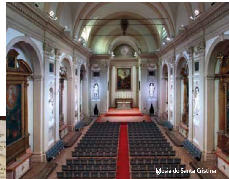
Iglesia de Santa Cristina